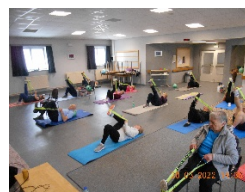
La gymnastique douce